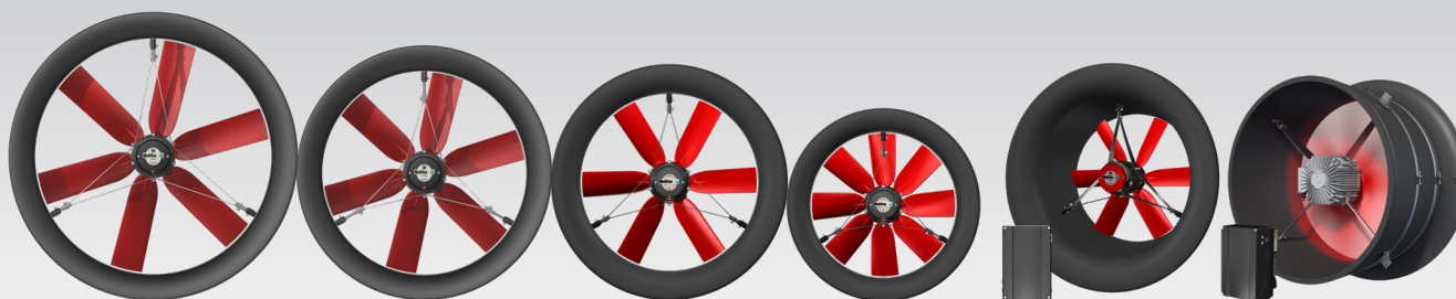
Verkrijgbaar in 63, 71, 82 en 92 cm