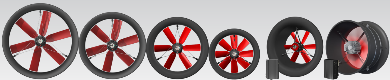
Gamme de ventilateurs haute pression 92, 82, 71 et 63 cm