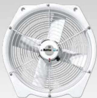
Ventilateur d'un brassage d'air de 45 cm