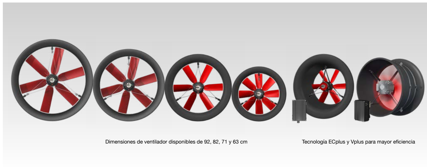
Dimensiones de ventilador disponibles de 92, 82, 71 y 63 cm